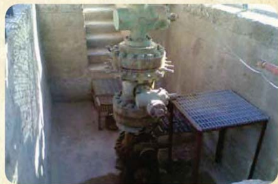
شکل ۱- نمای یکی از سلرهای چاه‌های گازی ایران

چاهی به چاه دیگر (در یک میدان واحد یا دو میدان مجزا) و برپایی آن نقش بسیار مهمی دارند که تأخیر در هر یک می‌تواند فرایند جابجایی دکل‌ها را با مشکل و اتلاف وقت و در نتیجه افزایش هزینه روبه‌رو سازد. در همین راستا به منظور بررسی عملیات جابجایی در ایران زمان جابجایی و انتظارات ناشی از عملیات جابجایی حدود ۵۸ دکل حفاری در قسمت خشکی و دریایی مورد بررسی و تجزیه و تحلیل قرار گرفت. (شکل-۲) که نهایتاً در مجموع مدت زمانی که به این عملیات اختصاص یافته بود بیش از ۴ دکل سال برآورد گردید که به طور میانگین جابه‌جایی‌های صورت گرفته به ازای هر دکل بیش از ۷۰۰ ساعت محاسبه شد. همچنین میزان انتظارات جابجایی این تعداد دکل در حدود ۱۵ درصد دکل سال بوده که سهم آن در مقایسه با کل انتظارات حفاری و جابجایی در حدود ۱۰ درصد می‌باشد.